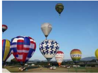
鈴鹿バルーンフェスティバル(9月) Suzuka Balloon Festival