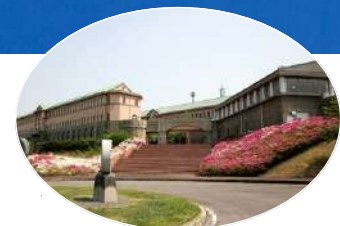
■鈴鹿大学の近くに立地しています。 Near the Suzuka university

当校は日本語教育機関の質的水準の向上に資すること及び、語学教育を通じて広く国際社会に貢献することを目的とし、主体性に溢れる人材育成として「学生が自ら発見し、自ら思考し、自ら行動する」の教育理念のもと、高等教育機関や産業界に数多くの卒業生を輩出することを目標としています。