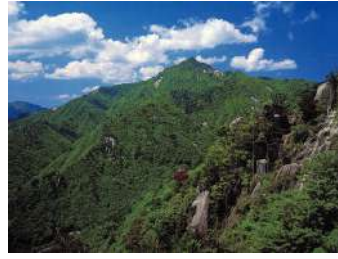
鈴鹿山脈 Suzuka Mountains