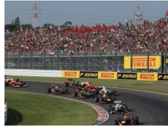
F1日本グランプリ(10月) F1 Japanese Grand Prix