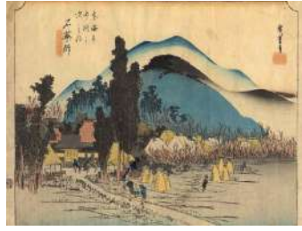
東海道石薬師宿 Ishiyakushi-juku Station