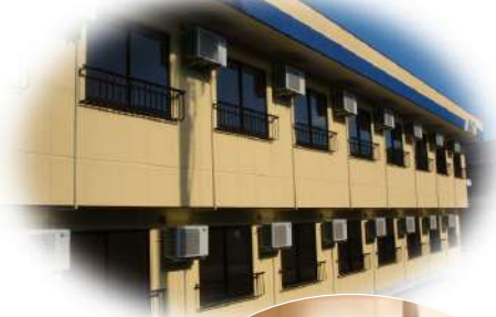
■快適な住居の紹介もしています。(写真は例)