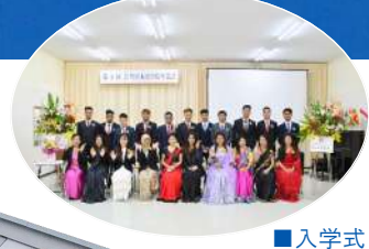
■入学式 Entrance ceremony